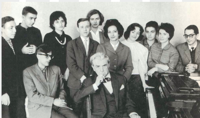
Heinrich Neuhaus mit seiner Klasse 1960

De Kawai “Heinrich Neuhaus” masterclass richt zich op studenten en aankomende pianisten die zich op wedstrijden, concerten, ingangsexamens e.d. voorbereiden of zich verder op het hoogste niveau willen vervolmaken.