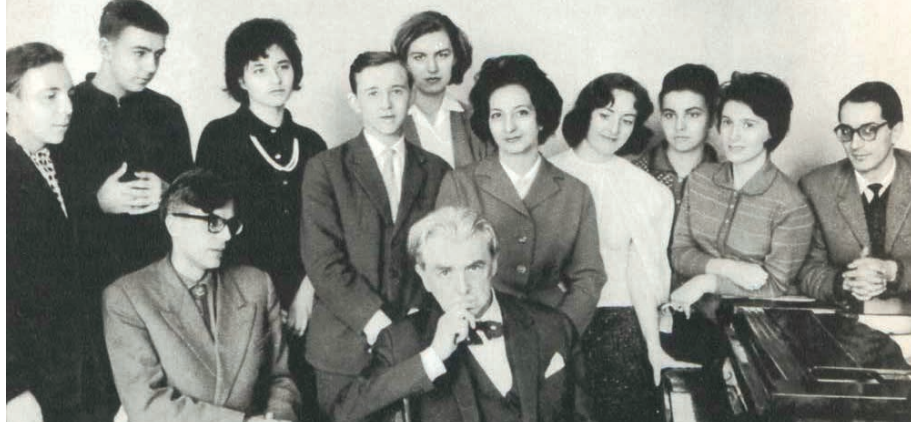
Heinrich Neuhaus mit seiner Klasse 1960

De studenten krijgen les van gerenommeerde pedagogen en pianisten: